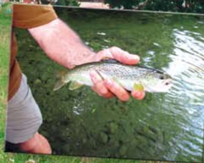
CHÂTEAU de MONTBEL