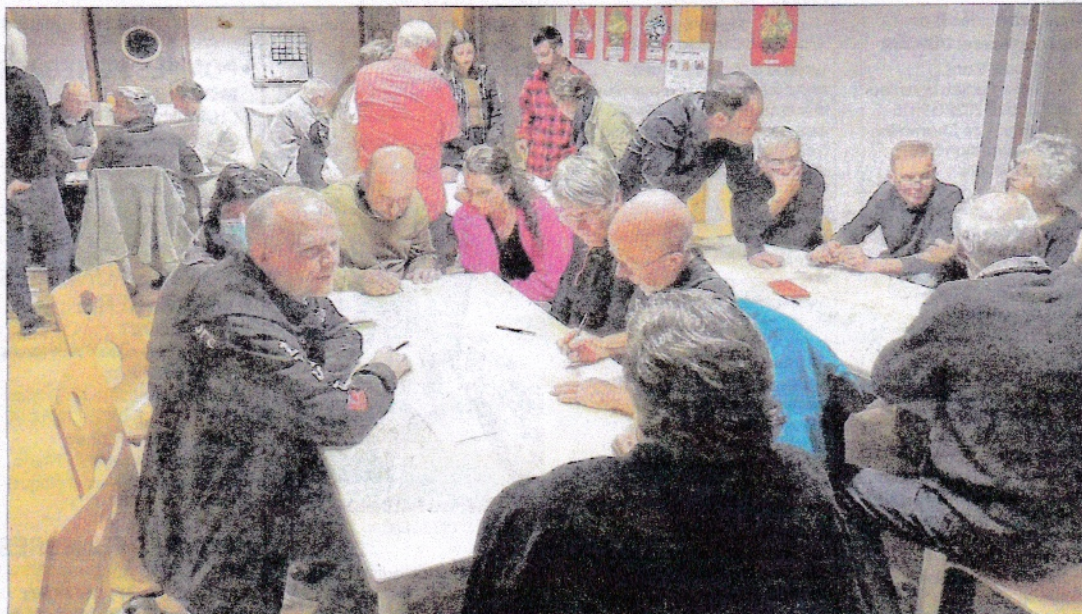
Les participants ont travaillé à partir des plans des aménagements.

Ils ont aussi exposé les contraintes techniques conditionnant les travaux : les canalisations de la chambre des vannes, la traversée de la départementale, le maintien des