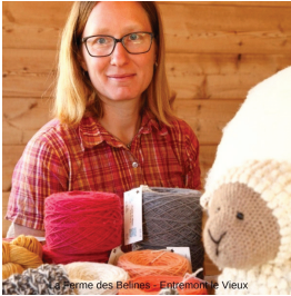
La Ferme des Bœufs - Entremont-le-Vieux

On peut retrouver les produits du groupement toute l'année au sein de la boutique de l'office de tourisme de Saint Pierre d'Entremont, ainsi que sur le site internet de la boutique : www.boutiqueartisanale-chartreuse.fr