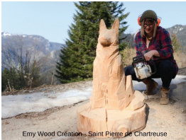
Emy Wood Création - Saint Pierre de Chartreuse